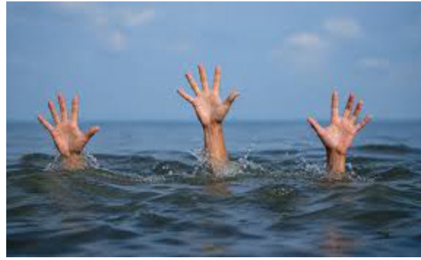
त्यांना नदीच्या पाण्यात पोहोण्याचा मोह झाला आणि इथेच मोठा घात झाला. हे तरुण नदीत उतरले मात्र पाण्याचा अंदाज न आल्यानं त्यांचा बुडून मृत्यू झाला

घटनेबाबत अधिक माहिती अशी की, विकेंड असल्यामुळे हे तरुण मावळ परिसरात फिरण्यासाठी आले होते. मात्र तिथे आपल्यासोबत काय घडणार आहे, याची थोडी सुद्धा कल्पना या तरुणांना नव्हती. कडाक्याच्या उन्हामुळे