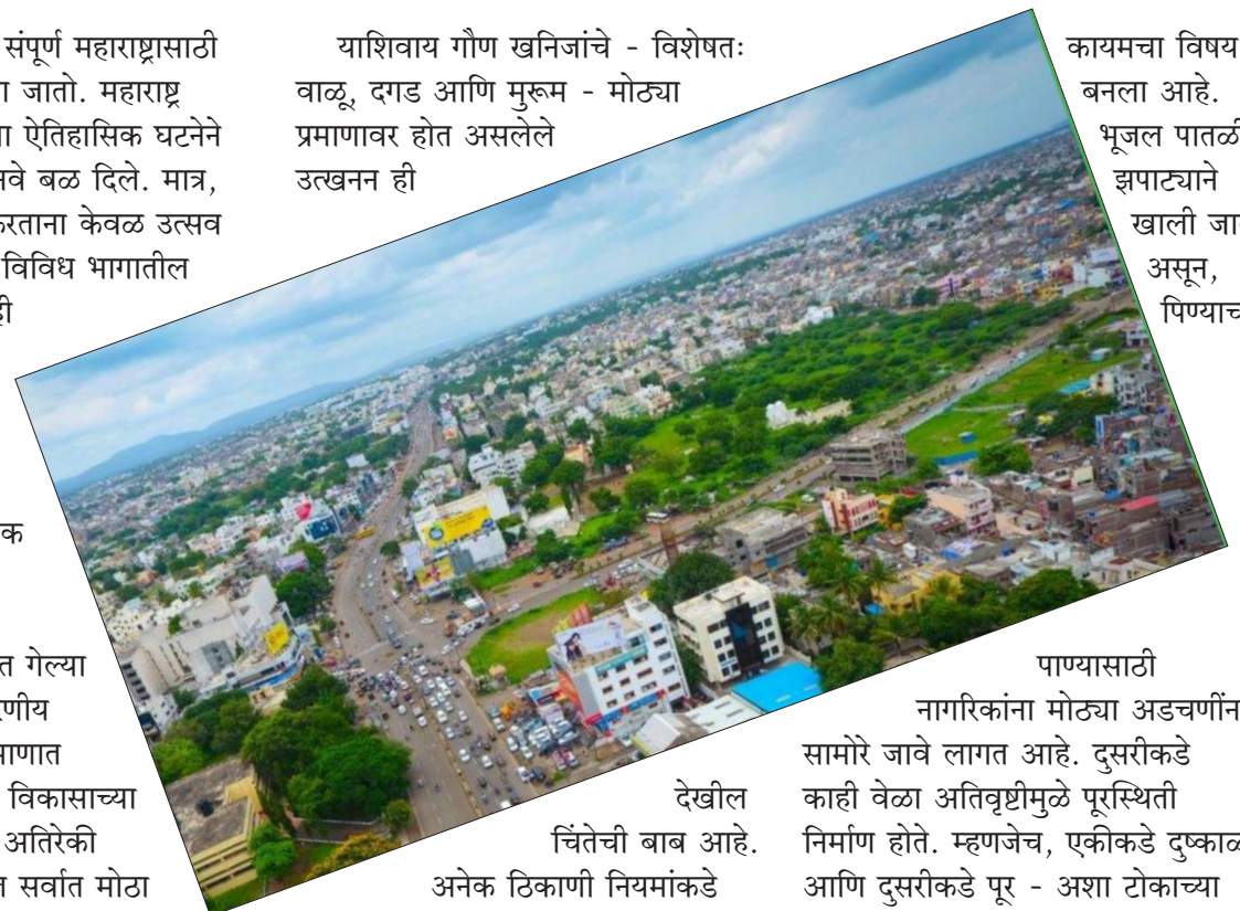
देखील चिंतेची बाब आहे. अनेक ठिकाणी नियमांकडे दुर्लक्ष करून केले जाणारे उत्खनन नैसर्गिक रचनेला हानी पोहोचवत आहे. यामुळे जमिनीची धूप वाढते, पाण्याचे स्रोत नष्ट होतात आणि भविष्यातील पर्यावरणीय संकट अधिक तीव्र बनते. पाण्याचा प्रश्न तर जालना जिल्ह्याचा

कारतो. याचा फटका सर्वाधिक गरीब आणि शेतकरी वर्गाला बसतो. शेतीचे उत्पन्न घटते, रोजगाराच्या संधी कमी होतात आणि स्थलांतर वाढते. या सर्व समस्यांचा एकत्रित परिणाम म्हणजे जालना जिल्ह्याचा विकास खुंटल्याचे चित्र दिसते. महाराष्ट्र दिनाच्या निमित्ताने या परिस्थितीकडे गांभीर्याने पाहणे आवश्यक आहे. विकास हवा, पण विनाश नको ही भूमिका आता केवळ घोषवाक्य न राहता कृतीत उतरवण्याची वेळ आली आहे. जलसंधारण, वृक्षारोपण, नियंत्रित खनन आणि पर्यावरणपूरक धोरणे यावर भर देऊनच जालना जिल्ह्याला या संकटातून बाहेर काढता येईल. नागरिकांचा सहभाग, प्रशासनाची जबाबदारी आणि जागरूकता या तिन्हीच्या एकत्रित प्रयत्नांतूनच बदल शक्य आहे. महाराष्ट्र दिन खऱ्या अर्थाने तेव्हाच साजरा होईल, जेव्हा जालना सारखे जिल्हेही विकासाच्या मुख्य प्रवाहात येतील आणि निसर्गासोबत समतोल साधत प्रगती करतील.