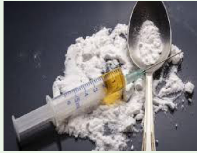
तसेच या पथकांना अत्याधुनिक 'ड्रग्स नालायझर'

प्रत्येक संबंधित पोलिस ठाण्यात स्वतंत्र 'अंटी-ड्रग्स पथक' स्थापन करण्यात येणार आहे. दोन अधिकारी आणि कर्मचाऱ्यांचा समावेश असलेले हे पथक ड्रग्सविरोधी कारवाईवर लक्ष ठेवणार आहे;